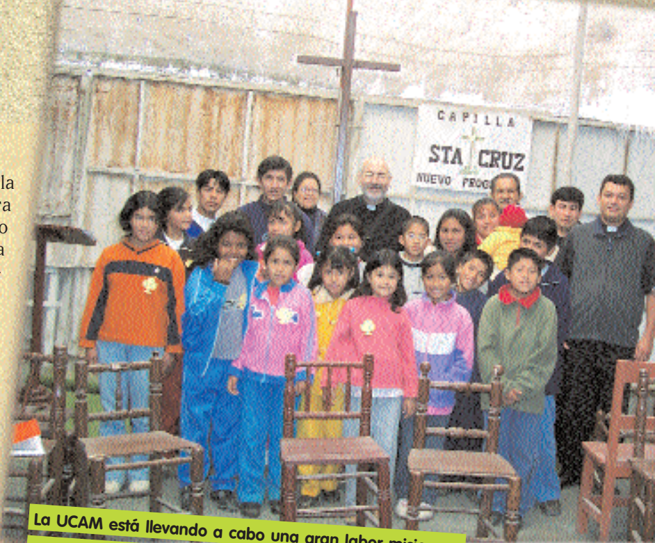
La UCAM está llevando a cabo una gran labor misionera en los barrios más pobres y marginales de Lima (Perú).