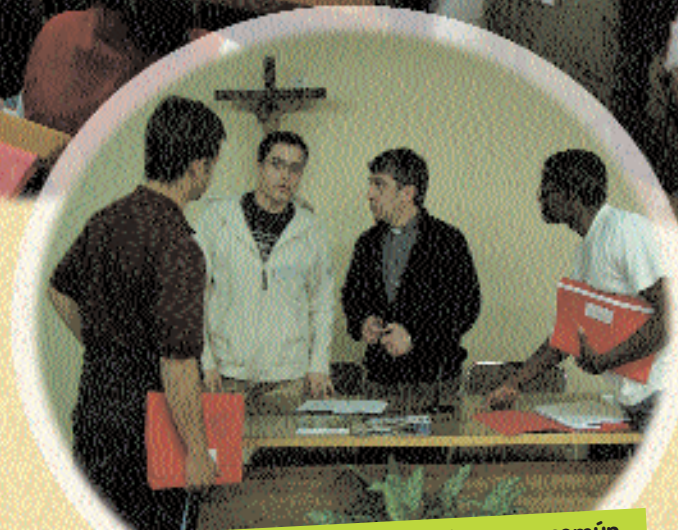
Ponencias, veladas misioneras, oraciones en común... todo se vivió en un clima de amistad y compañerismo.